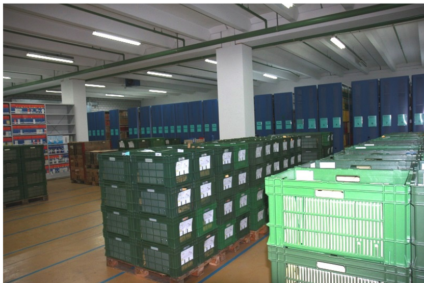
Magazin 1 im PTT-Archiv Köniz mit Paletten, die noch ausgepackt werden mussten, April 2013.

Aufgrund des Wasservorfalles im Februar hat der Vermieter den Boden in der Einstellhalle auf Dichtigkeit untersuchen lassen und kann diese nun garantieren.