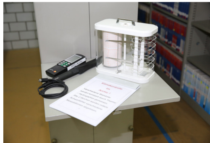
Thermohygrograph und Schwertfühler zum Messen der Temperatur und Luftfeuchtigkeit.

Das PTT-Archiv hat planmässig Massnahmen zur Bestandserhaltung durchgeführt. Dazu liess es sechs Chargen (132 lfm von rund 4'830 kg) in der Papierentsäuerung in Wimmis entsäuern. Das Ergebnis fällt zur Zufriedenheit aus. Es wurde dennoch ein Ammoniakgeruch bei bereits entsäuerten Beständen (aus dem Zeitraum 2007-2009) festgestellt. Dieses Phänomen wurde der Nitrochemie mitgeteilt, die nun die Ursache dafür abklärt. Mit einem detaillierten Notfallkonzept wurde im Berichtsjahr begonnen.