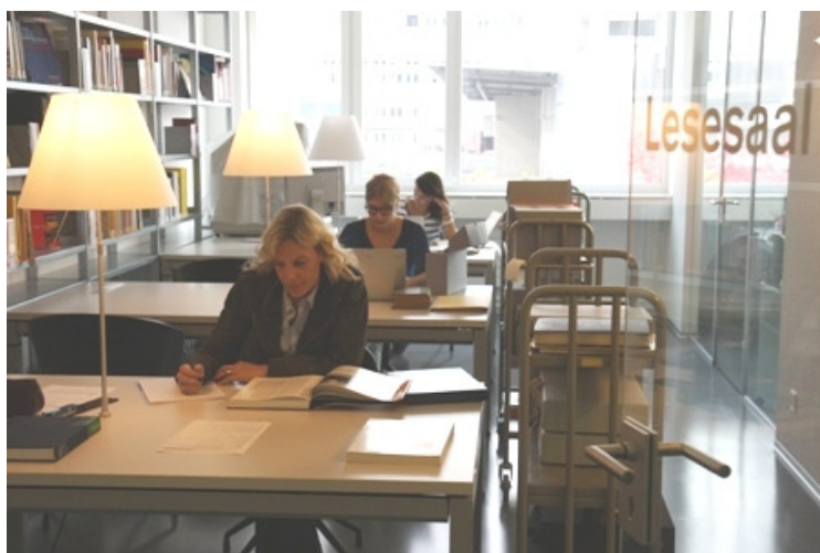
Lesesaal PTT-Archiv in Köniz im September 2013.

Nationalbibliothek und PTT-Archiv vereinbarten eine Kooperation. Das PTT-Archiv beteiligt sich neu als Anlaufstelle zu den Themen Post, Philatelie, Verkehr und Telekommunikation am swissInfoDesk. Damit ist eine weitere Vernetzung mit verwandten Institutionen und die Steigerung der Bekanntheit geglückt. Seit 2013 ist das PTT-Archiv auch Mitglied des International Council on Archives (ICA) und somit auch international besser vernetzt.