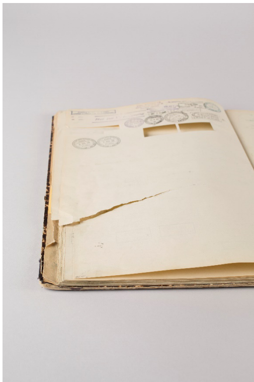
Abb. 5: Riss im Buchblock

Eine Gefahr stellen ebenfalls die ca. 70 Einzelblätter mit diversen Stempeln dar. Die Stempel in verschiedenen Formaten sind dem Sammelband lose oder in Zwischenlagepapiere beigelegt und können durch die Benutzung zu weiterem Materialverlust führen.