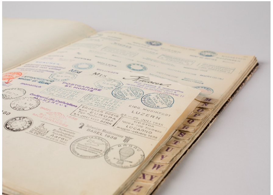
Abb. 2: Detail der Stempelabdrücke im Register M