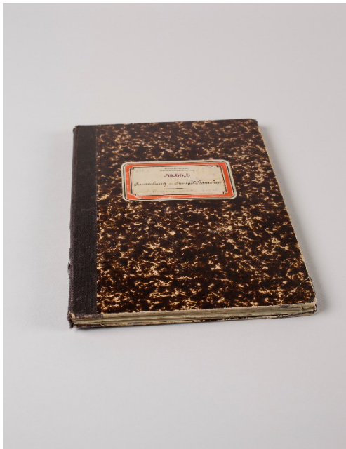
Abb. 1: N°66 b, Band mit Stempelabdrücken