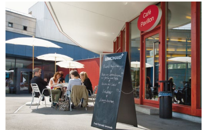
Das Café Pavillon ist ein beliebter Treffpunkt im Kirchenfeld-Quartier.

Der Bereich Sammlungen unterstützte wiederum zahlreiche Institutionen und Interessierte mit Leihgaben und Informationen. Bearbeitet wurden insgesamt 448 Anfragen (Vorjahr: 520). Wie im Vorjahr betrafen rund 60% der Anfragen Bildrecherchen sowie die Ausleihe von Reproduktionen und historischen Filmen. 40% der Anfragen betrafen fachliche Auskünfte.