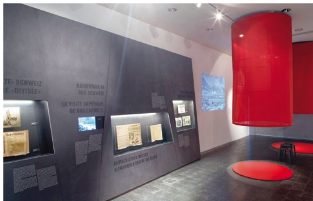
« Im Feuer der Propaganda » zeigte viele Zeitungen, Zeitschriften, Plakate und Postkarten im Original.

« Im Feuer der Propaganda. Die Schweiz und der Erste Weltkrieg » (21. August bis 9. November 2014) stiess ebenfalls auf viel Interesse. Es war die erste Co-Produktion des Museums für Kommunikation und der Schweizerischen Nationalbibliothek. Die Ausstellung zeigte den Propagandakrieg und die grosse innere Zerrissenheit der Schweiz während dem Ersten Weltkrieg. Die rund zweihundert ausgestellten Dokumente stammten vor allem aus den Sammlungen der beiden Häuser.