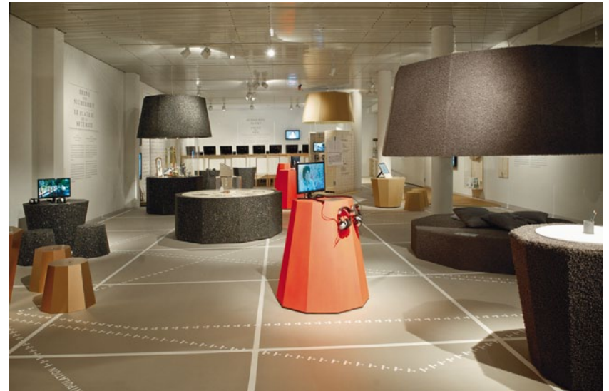
Blick in die Ausstellung «Rituale. Ein Reiseführer zum Leben» .

Die Ausstellung «Rituale. Ein Reiseführer zum Leben» (8. November 2013 bis 20. Juli 2014) widmete sich den kleinen und grossen Ritualen, die uns sicher durchs Leben begleiten. Rituale geben Halt, stiften Identität und Vertrauen, vermitteln Zugehörigkeit und Sicherheit. Als Kommunikationscodes regeln sie das Verhalten in einer Gemeinschaft. Die Ausstellung regte zur Auseinandersetzung mit bekannten Ritualen an, lieferte aber auch das Rezept für massgeschneiderte neue Rituale. 31'375 Besucherinnen und Besucher sahen die Ausstellung. In der Besucherbefragung schnitt «Rituale. Ein Reiseführer zum Leben» sehr gut ab: Über 90% der Befragten bewerteten die Ausstellung mit gut bis sehr gut.