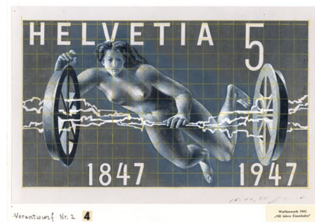
Hans Erni, Vorentwurf anlässlich des Wettbewerbs für Sondermarken zum Jubiläum «100 Jahre Schweizerische Eisenbahnen (1947)», nicht realisiert. Sammlung Museum für Kommunikation

Das Museum für Kommunikation hat im Berichtsjahr zwei Publikationen veröffentlicht. In der Schriftenreihe des Museums erschien «Pöschenried-Briefe. Eine Familiengeschichte aus dem Simmental (1921–1952)», zur Wechselausstellung « Oh Yeah! Popmusik in der Schweiz » die Begleitpublikation «Oh Yeah! 200 Pop-Photos aus der Schweiz».