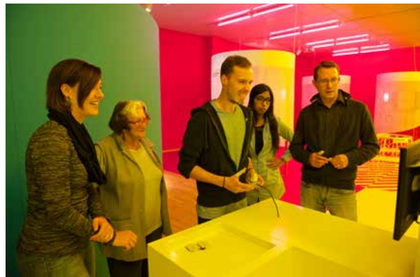
L'exposition Dialogue avec le temps n'a pas seulement été un franc succès, elle a aussi misé sur une transmission inhabituelle des contenus en faisant appel à 33 guides senior. Elle a plu à environ 95% des visiteurs.

Le finissage a été suivi par d'importants travaux dans les coulisses: les anciennes expositions permanentes ont été démontées et l'infrastructure du bâtiment rafraîchie jusqu'à la fin de l'année.