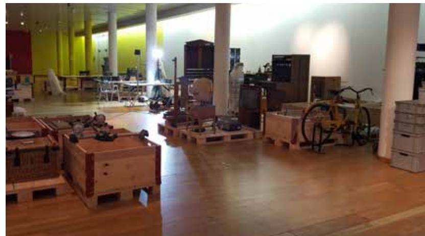
Lors du démontage des anciennes expositions et de la préparation de la nouvelle exposition, l'équipe en charge des collections a dû emballer soigneusement des centaines d'objets.