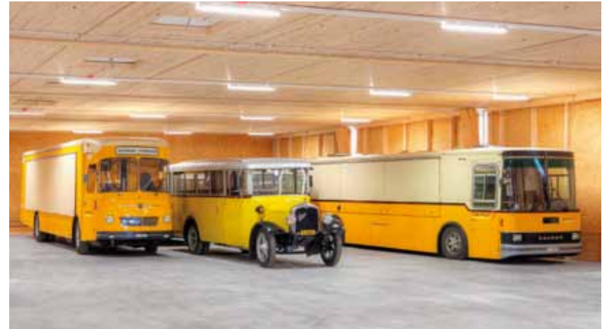
La nouvelle halle que le musée a construite à Schwarzenburg pour abriter ses véhicules a reçu le Prix Lignum or, à l'échelle nationale, pour la construction audacieuse de l'architecte Patrick Thurston. A première vue insignifiante, elle utilise les propriétés naturelles du bois pour réguler l'atmosphère.

A côté de l'inventaire de la collection photographique, l'accent a été mis sur l'inventaire et la conservation des projets de timbres-poste suisses de 1850 à 1970. Le musée a pu mettre un terme aux mesures conservatoires préventives et commencer la numérisation des projets de timbres. Dans le domaine photographique, les collections de Photohaus Gabler (Interlaken) et Engadin Press (Samedan) ont été complètement inventoriées. La sauvegarde et la numérisation de la collection de films et de vidéos ont commencé à l'automne 2015 par la vidéo après que Memoriav ait assuré une subvention notable pour 2016. Environ 900 objets sur bande magnétique ont été transmis à un prestataire externe pour numérisation.