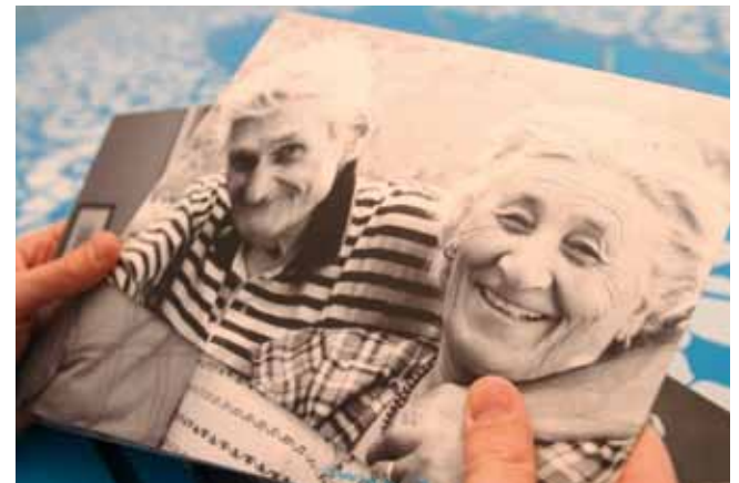
En fait, Dialogue avec le temps n'est pas une exposition, mais une rencontre avec l'âge.

Elles débattent avec les visiteurs des clichés, préjugés et peurs associés à la vieillesse, au fil de la découverte de l'exposition, et leur communiquent ainsi l'art de bien vieillir. L'exposition a été très bien accueillie et a bénéficié d'un bel écho dans les médias. Elle dure encore jusqu'au 10 juillet 2016.