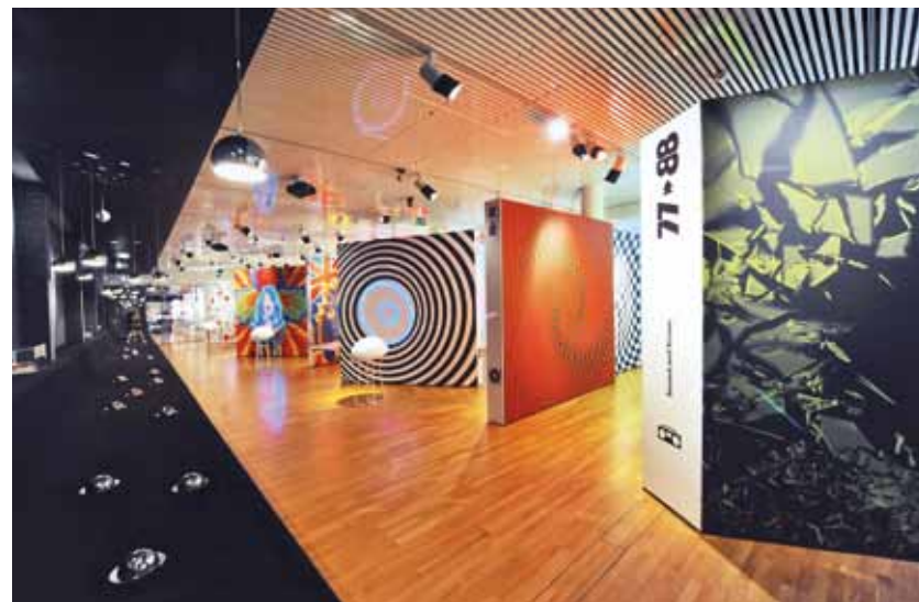
L'exposition Oh Yeah! est celle qui a remporté le plus de succès parmi les expositions que le Musée de la communication a produites lui-même au cours de son histoire, avec quelque 38'000 visiteurs.

Le musée conserve son caractère exemplaire dans le domaine Formation et médiation. Pas moins de 1'198 classes provenant de toute la Suisse ont visité le Musée de la communication en 2015.