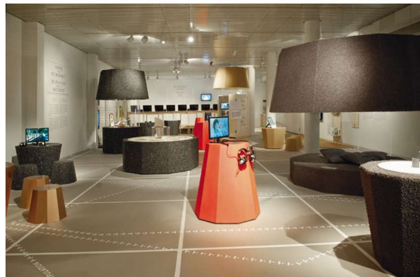
Aperçu de l'exposition « Rituels. Un guide de vie ».

L'exposition « Rituels. Un guide de vie » (du 8 novembre 2013 au 20 juillet 2014) était consacrée aux petits et grands rituels qui nous accompagnent dans notre vie quotidienne et lors de nos fêtes. Les rituels structurent, affermissent l'identité et donnent confiance, ils rassurent et solidarisent. Ils sont des codes de communication qui régissent notre comportement en société. L'exposition incitait à réfléchir sur les rituels connus et traditionnels, elle livrait aussi la recette de nouveaux rituels taillés sur mesure. 31'375 personnes l'ont vue. Dans un sondage aux bases scientifiques, « Rituels. Un guide de vie » a obtenu de très bonnes notes: plus de 90% des visiteurs ont jugé l'exposition bonne à très bonne.