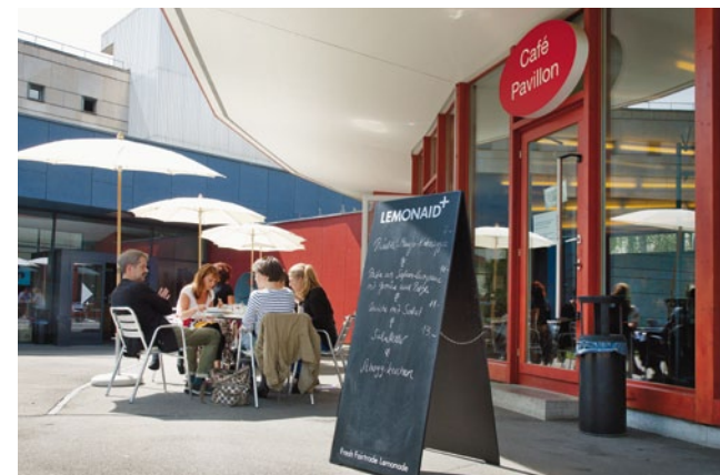
Le Café Pavillon est un lieu de rendez-vous apprécié dans le quartier du Kirchenfeld.

Le domaine des collections a une nouvelle fois aidé de nombreuses institutions et personnes intéressées par des prêts et des informations. 448 requêtes ont été traitées au total (2013: 520). Environ 60% d'entre elles concernaient des recherches d'images et des prêts de reproductions et de films historiques, les quelque 40% restants portaient sur des informations relevant des différents domaines du musée.