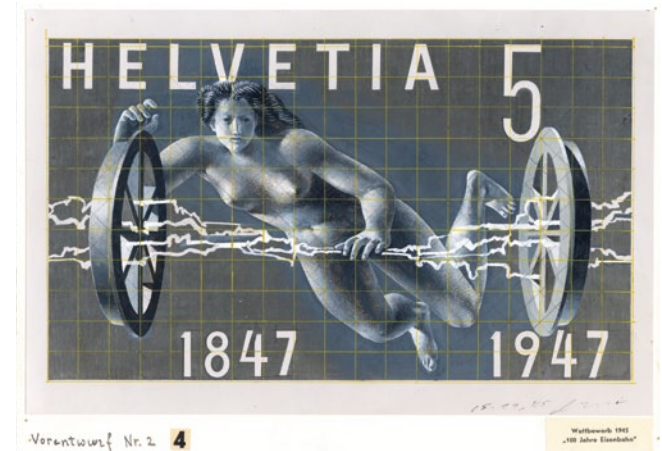
Hans Erni, projet créé lors du concours de timbres spéciaux organisé pour les «100 ans des Chemins de fer suisses (1947)», non réalisé. Collection du Musée de la communication

Musée de la communication a publié deux ouvrages en 2014: «Pöschchenried-Briefe. Eine Familiengeschichte aus dem Simmental (1921–1952)» est paru dans la série de publications du musée. L'exposition «Oh Yeah! La musique pop en Suisse» a quant à elle fourni au musée l'occasion de publier «Oh Yeah! 200 Pop-Photos aus der Schweiz».