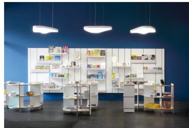
Une nouvelle couleur sur les murs, des présentoirs modernes et des lampes LED insufflent une atmosphère accueillante au foyer du musée après le rafraîchissement de la boutique.

Le domaine des collections a une nouvelle fois aidé de nombreuses institutions et personnes intéressées par des prêts et des informations. La statistique établie pour la première fois sur une année fait état de 543 requêtes. Environ 65% d'entre elles concernaient des recherches d'images et des prêts de reproductions et de films historiques. Les 35% restants portaient sur des informations relevant des différentes spécialités du musée.