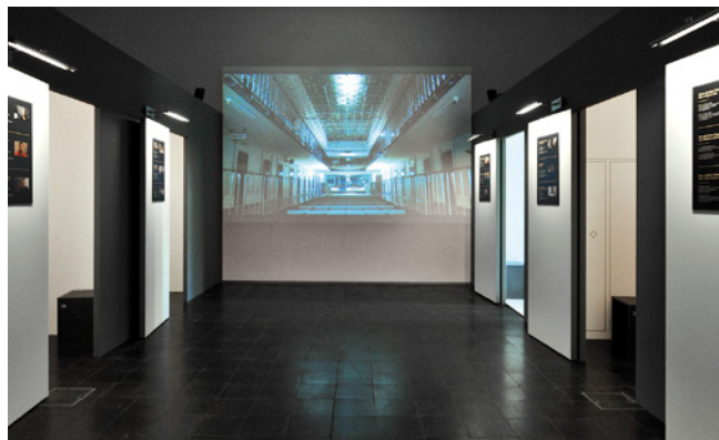
Dans l'exposition « Thorberg. Derrière les grilles. », 18 détenus racontent leur vie. Le quotidien de la prison est présent via la projection sur grand écran du couloir central.

A l'automne, le Musée de la communication a présenté pendant deux mois l'exposition « Thorberg. Derrière les grilles. » Le cinéaste Dieter Fahrer y a montré des portraits filmés de détenus qu'il a réalisés dans l'établissement bernois de Thorberg. Ces portraits étaient diffusés dans six cellules reconstituées selon le modèle original. L'exposition, fruit d'une coproduction avec Balzli & Fahrer, a permis au public de voir pour la première fois ce qui se passe derrière les murs de Thorberg. Wenger & Zurflüh ont réalisé une scénographie simple et convaincante sur l'idée de Dieter Fahrer. Les réactions positives que le musée a reçues montrent qu'il vaut la peine de se pencher sur ce sujet difficile.