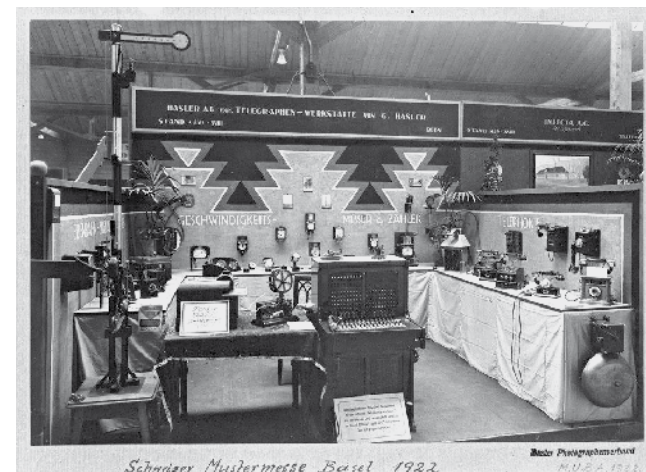
Le stand de la société Hasler à la MUBA de 1922.

L'inventaire du contenu des collections d'objet et l'intégration des images dans la banque de données du musée se sont encore améliorés. Quelque 21'500 illustrations d'objets y sont intégrées; autrement dit, plus de 95% des objets des collections de la poste, des télécommunications, de la radio/TV, de l'informatique, de l'histoire de la culture et de la technique et de l'art peuvent être recherchés en ligne avec une image. Lien vers la banque de données: http://datenbanksammlungen.mfk.ch