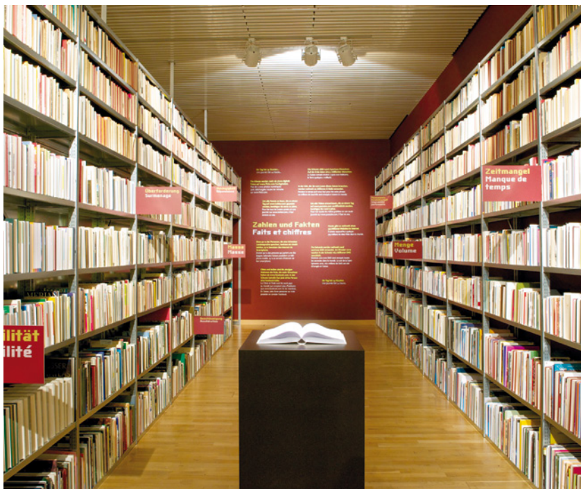
Dans le foyer de l'exposition « Attention: communiquer nuit. », 12'000 livres illustrent le flot quotidien de la communication.

L'exposition « Attention: communiquer nuit. » a fermé ses portes mi-juillet 2012 au bout de huit mois. Elle était consacrée au flot de la communication qui nous submerge et semble nous dépasser dans notre vie quotidienne. Le Musée de la communication a ouvert pour l'occasion une « Clinique de la communication » où les visiteurs pouvaient faire établir leur indice personnel de communication. Au terme de leur visite, ils repartaient armés de conseils et de stratégies leur permettant d'adopter un comportement détendu et judicieux face au flot de la communication. Le sujet de l'exposition comme sa mise en scène ont beaucoup plu au public. 31'705 personnes ont vu l'exposition, 92% d'entre elles l'ont jugée bonne à très bonne. Le Musée de la communication a collaboré étroitement avec Holzer Kobler Architekturen pour la mettre sur pied.