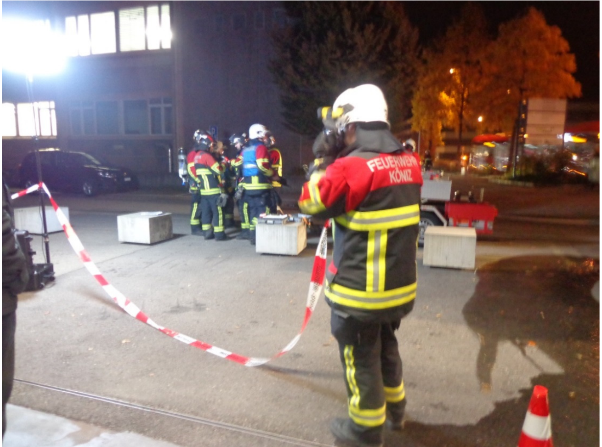
Gemeinsam üben wir den Katastrophenfall im Archiv mit der Feuerwehr Köniz und dem Kulturgüterschutz Köniz. Bild vom 31.10.2016.

Damit Daten für die digitale Langzeitarchivierung besser in das Langzeitarchivierungssystem übernommen werden können, wurde eine Glasfaserleitung von Swisscom zum Archiv verlegt.