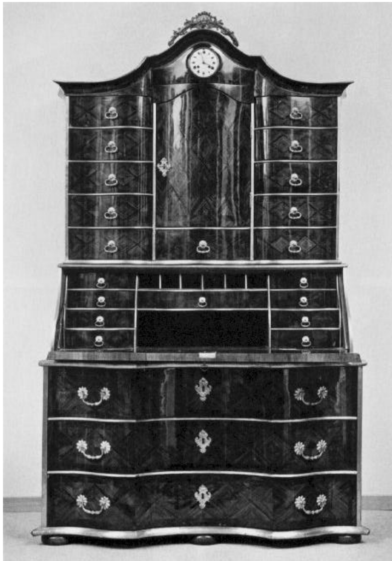
Hallers Schreibtisch, im Louis XIV-Stil; vom Berner Ebenisten M. Funk geschaffen, Foto aus Balmer 1977