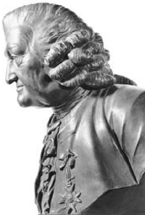
Bronzierte Gipsbüste von J. F. Funk, Bürgerbibliothek Bern; Weese 1909 Nr. 142