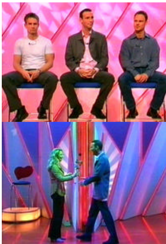
aus der TV-Sendung „Herzblatt“ (ARD)