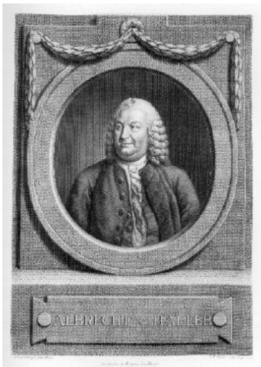
Kupferstich von J. F. Bause, nach S. Freudenberger; Weese 1909 Nr. 78