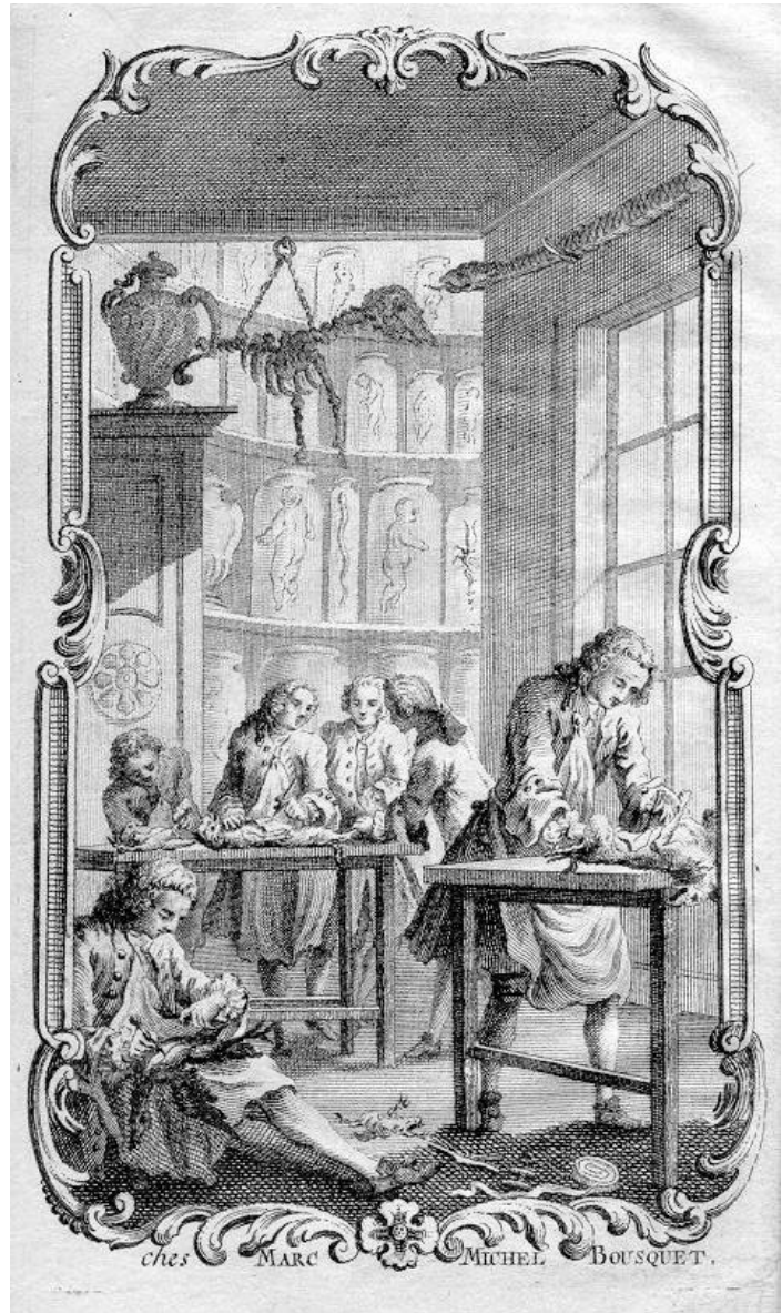
Sektionsraum im Göttinger Anatomiegebäude; Titelpupfer zu *Mémoires irrit. 1756-60